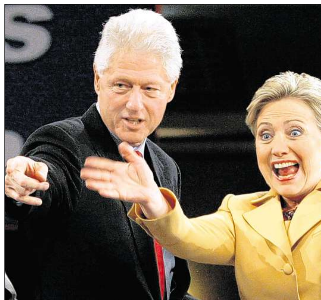
FREUDE ÜBER IHREN VORSPRUNG: Hillary Clinton und ihr Ehemann Bill bei einer Wahlparty in New York.