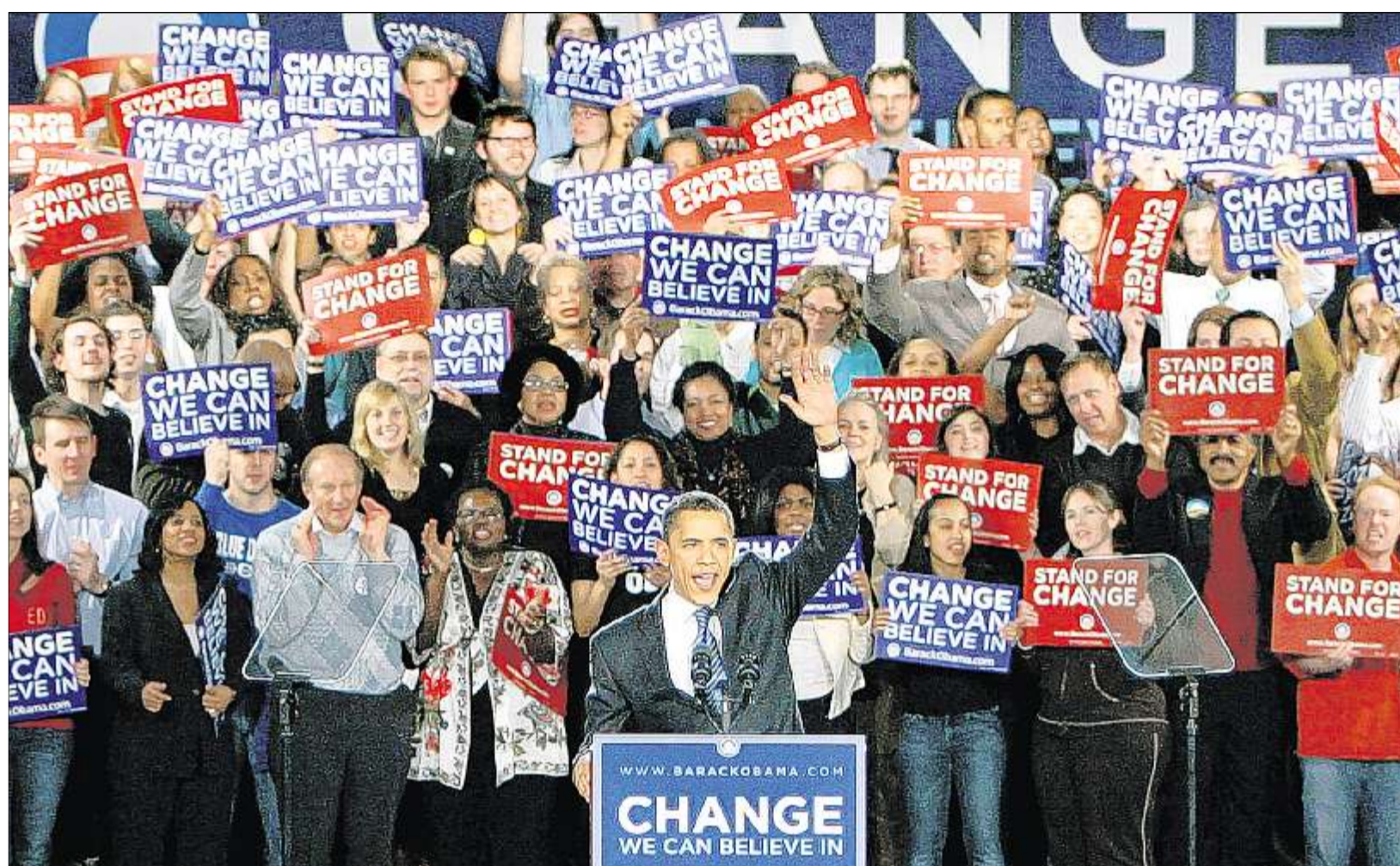
HOFFUNGSVOLL bejubeln Anhänger von Barack Obama den 46-jährigen Senator in Chicago, der nach dem Super-Dienstag Mitbewerberin Hillary Clinton knapp auf den Fersen ist.