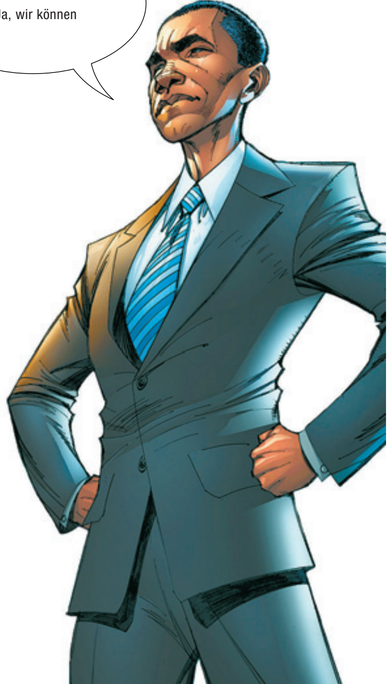
... und Barack Obama