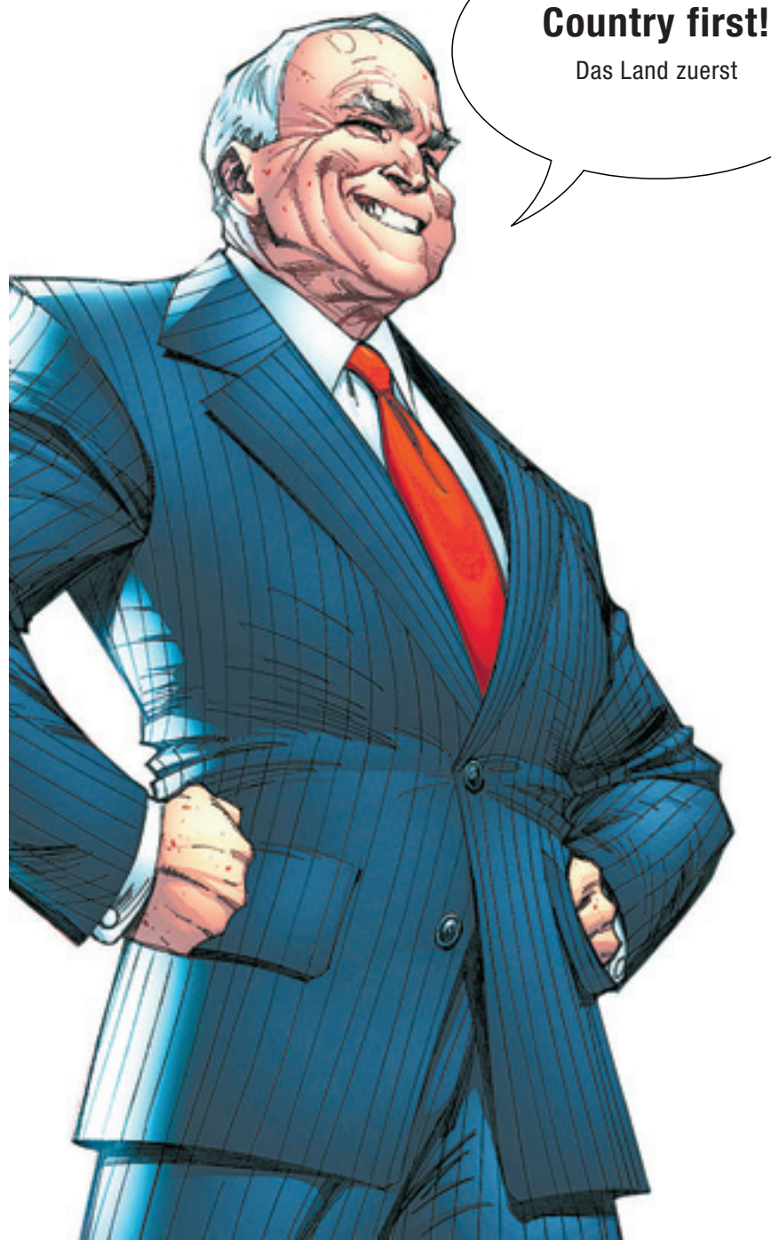
Die Kandidaten als Comic-Figuren: John McCain ...