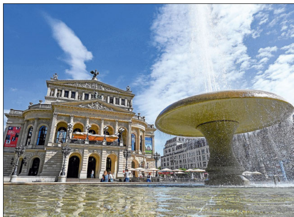
Der Lucae-Brunnen sprudelt auf dem Opernplatz vor der Frankfurter Alten Oper.